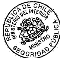
VÍCTOR PÉREZ VARELA MINISTRO DEL INTERIOR Y SEGURIDAD PÚBLICA